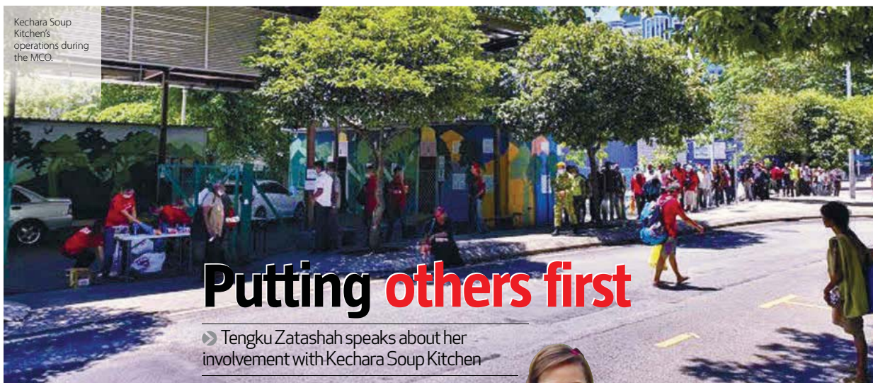
Kechara Soup Kitchen's operations during the MCO.

Provided for client's internal research purposes only. May not be further copied, distributed, sold or published in any form without the prior consent of the copyright owner.