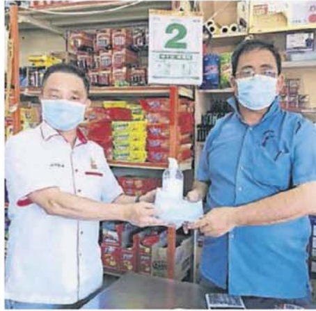
■黃瑞林（左）贈送口罩和洗手液給商家時，也聆聽業者對經濟遭重創的擔憂。

（适耕庄5日讯）行动管制令进入最後两周的决战时期，深受冲击的中小企业也担忧，若疫情持续蔓延，再度延长的行管令将重创国内经济，为此雪州议长黄瑞林希望卫生部，在疫情严重的地区落实“全民检验”，全面杜绝疫情蔓延。