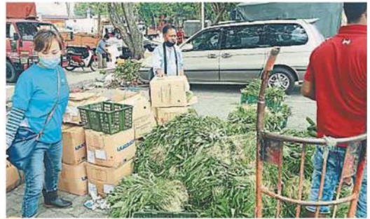
↑ 赞助商把蔬菜运送到星君士拉央站, 准备进行分类和包装。