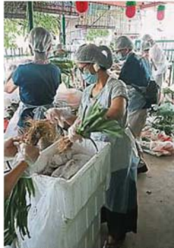
派送活动是由义工协助上门派送给受惠者, 以免人群聚集的问题发生。图为义工合力分类蔬菜及进行包装工作。

读者也怀疑这群罗兴亚人是前往由国州议员联同非政府组织所举办的免费派送菜活动——“蔬菜补助计划”。