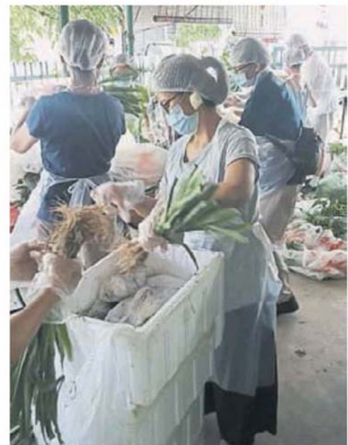
■ 义工們在做蔬菜分類和包裝。

有意贊助或報效食品的商家或個人可聯絡012-2983721 (May) 或012-3213133 (Low)。