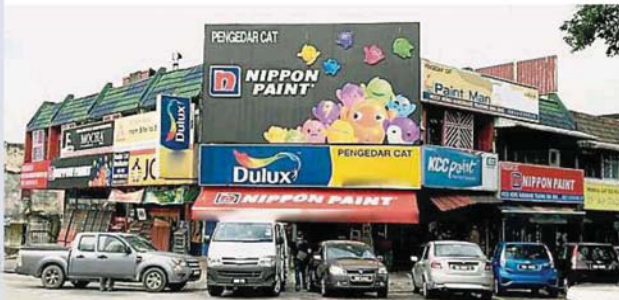
全国五金店自本月2日(星期四)起获准每周两天恢复营业后,对雪隆地区五金零售业者来说是一场及时雨,有助解决燃眉之急。

(吉隆坡5日讯)冠状病毒疫情的行动管制令进入次阶段后,政府逐步放宽部分商业领域恢复操作,包括允许五金店每周2天重新营业后,对雪隆地区五金零售业者来说是一场及时雨,有助解决燃眉之急。 随着国家安全理事会于上周四(2日)发出正式通知,允许五金店每周2天重新营业后,五金店业者表示欢迎及感到欣慰,部分州府也开始陆续制订后续规定,列明五金店的2个营业日落在星期几,以及限定营业时间。 截至截稿为止,雪州政府及吉隆坡市政局尚未公布相关规定。因此,五金店业者纷纷吁请雪隆两地政府当局尽快发布通知,以便他们做好准备恢复五金门市作业及通知员工上班。