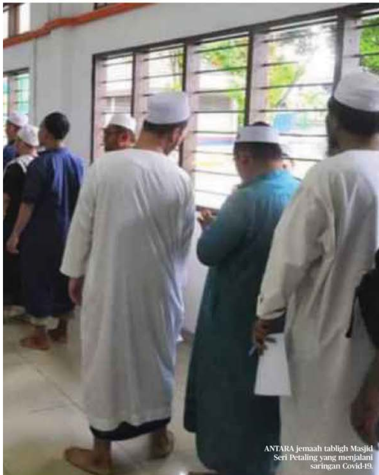
ANTARA jemaah tabligh Masjid Seri Petaling yang menjalani saringan Covid-19.