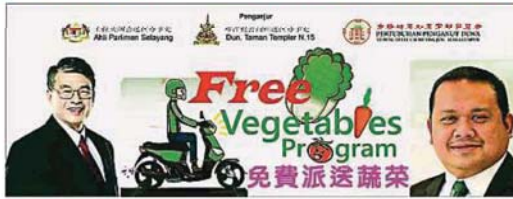
士拉央国州议员联同吉隆坡玉封至富财帛星君举办免费派送蔬菜活动, 以帮助区内行动管制令期间有需要的贫困家庭。