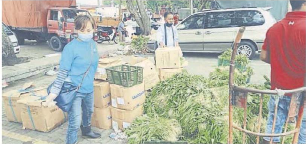
■ 贊助商們把蔬菜運到星君士拉央站。

(吉隆坡5日訊) 由士拉央國會議員及雙溪多州議員辦事處主辦，吉隆坡玉封至富財帛星君廟協办的“蔬菜輔助計劃”反應非常熱烈。