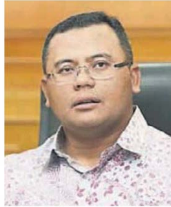
■雪州大臣拿督斯里阿米鲁丁

(莎阿南5日讯)雪州大臣拿督斯里阿米鲁丁促请我国领导与人民，必须适应新的生活习惯与日常，以对抗肆虐全球的新冠肺炎（2019新型冠状病毒疾病）疫情带来的挑战。